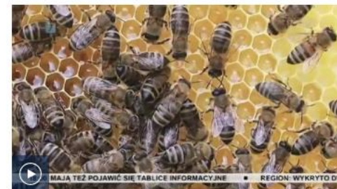
Lubelskie - wspólnie dla pszczół: 30 lipca 2020