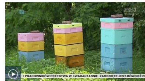
Lubelskie - wspólnie dla pszczół: 30 lipca 2020