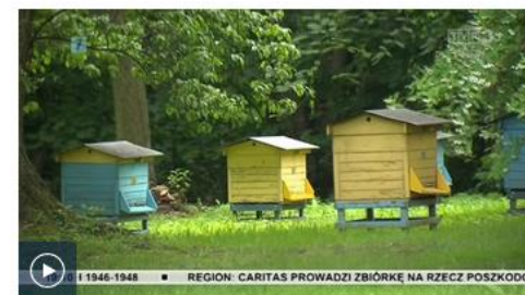
Lubelskie - wspólnie dla pszczół: 14 sierpnia 2020