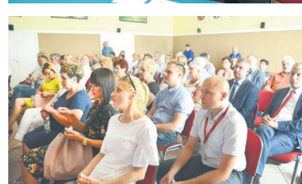
PODPISANIUMOWY towaryzyszylo duze zainteresowanie

Będzie to najszybsza trasa komunikacyjna z Lublinem, pozwalająca na włączenie Lubartowa do ruchu na zapowiadanej trasie ekspresowej S19. Wszystko to jest możliwe dzięki unijnemu dofinansowaniu oraz środkom własnym z budżetu województwa.