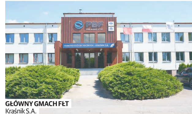
GŁÓWNY GMACH FET Kraśnik S.A.

rynku pracy, podniesienie kompetencji i kwalifikacji nauczycieli kształcenia zawodowego i praktycznej nauki zawodu. Projekty obejmują także płatne staże i praktyki dla uczniów oraz wyposażenie pracowni przedmiotów zawodowych.