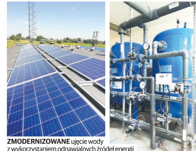
ZMODERNIZOWANE ujęcie wody z wykorzystaniem odnawialnych źródeł energii

- Dzięki dobrej współpracy z Urzędem Marszałkowskim Województwa Lubelskiego udało nam się pozyskać już ponad 5 mln zł. Z projektów, które otrzymały dofinansowanie, na szczególną uwagę zasługuje m.in. projekt in-