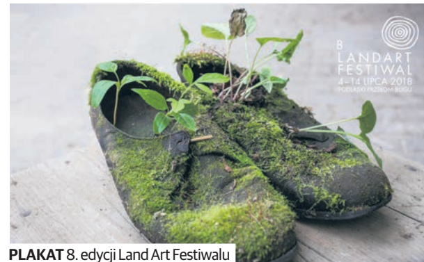
PLAKAT 8. edycji Land Art Festiwalu

4 lipca rusza kolejna edycja festiwalu Land Art. To impreza, która od 8 lat wędruje po miejscach szczególnie cennych na mapie woj. lubelskiego, ale nie stanowiących centrów gospodarczych czy kulturalnych. Hasłem tegorocznej edycji jest „Święto”.