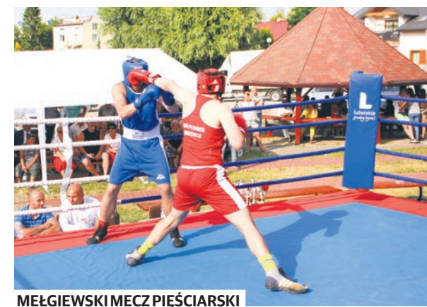
MEŁGIEWSKI MECZ PIĘŚCIARSKI