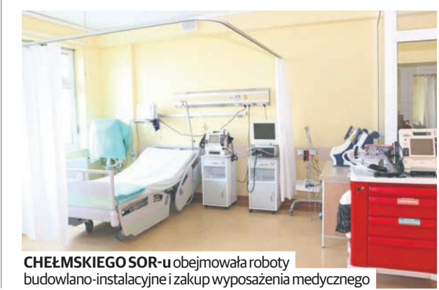
CHEŁMSKIEGO SOR-u obejmowała roboty budowlano-instalacyjne i zakup wyposażenia medycznego