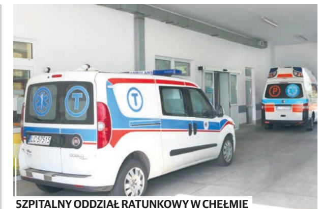
SZPITALNY ODDZIAŁ RATUNKOWY W CHEŁMIE przeszedł gruntowną modernizację