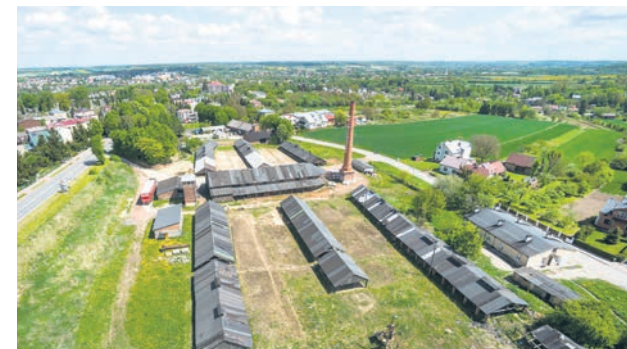
CEGIELNIA HOFFMANOWSKA w Kraśniku