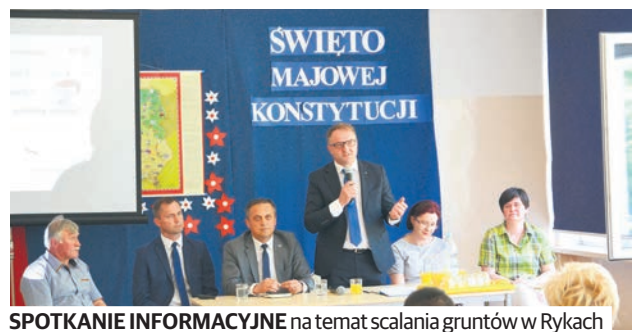
SPOTKANIE INFORMACYJNE na temat scalania gruntów w Rykach

zji w Lublinie (podlegającemu pod Zarząd Województwa) i Starosty Zamojskiego za opracowanie założeń do projektu scalenia na obszarze Sulmice, gmina Skierbieszów. – To wyróżnienie świadczy o bardzo dobrej współpracy pomiędzy samorządem województwa i powiatami. – komentuje wicemarszałek Grzegorz Kapusta.