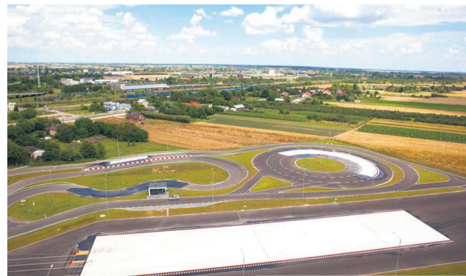
OŚRODEK DOSKONALENIA TECHNIKI JAZDY