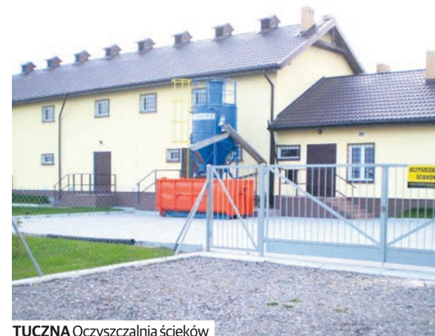
TUCZNA Oczyszczalnia ścieków

Mimo wielu ograniczeń, małą gminę Tuczna można scharakteryzować jako wzór w pozyskiwaniu funduszy europejskich z wielu źródeł. W perspektywie finansowej 2007-2013 na obszar gminy udało się pozyskać środki w wysokości ponad 20 mln zł. Zostały one przeznaczone na projekty infrastrukturalne, np. budowę gminnej oczyszczalni ścieków, kanalizacji i przydomowych oczyszczalni ścieków oraz projekty edukacyjne, kul-