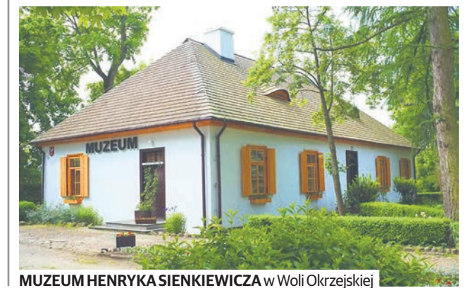
MUZEUM HENRYKA SIENKIEWICZA w Woli Okrzejskiej