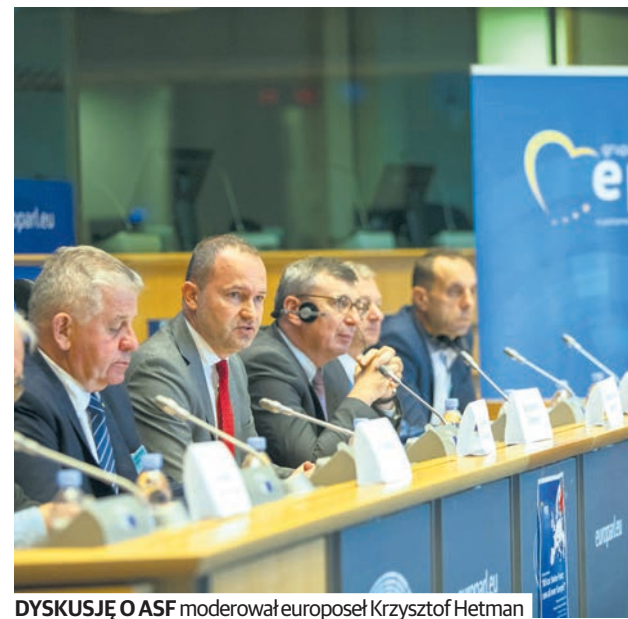
DYSKUSJĘ O ASF moderował europoseł Krzysztof Hetman

W spotkaniu wzięli udział specjaliści, hodowcy i samorządowcy z Polski, Hiszpanii i Ukrainy. - Trzeba sobie zdać sprawę z tego, że wirus cały czas się rozprzestrzenia. To bardzo istotne, aby przenieść dyskusję o ASF na poziom europejski. Sami sobie z tym nie poradzimy. To nie jest pro-