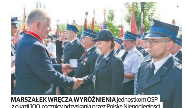
MARSZAŁEK WRĘCZA WYRÓŻNIENIA jednostkom OSP z okazji 100. rocznicy odzyskania przez Polskę Niepodległości

Strażacy z całego województwa lubelskiego wzięli udział w uroczystych obchodach Wojewódzkiego Dnia Strażaka 2018 połączonych z obchodami 160-lecia istnienia Ochotniczej Straży Pożarnej łączna.