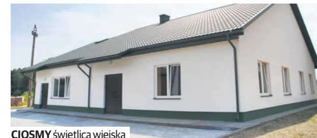
CIOSMY świetlica wiejska