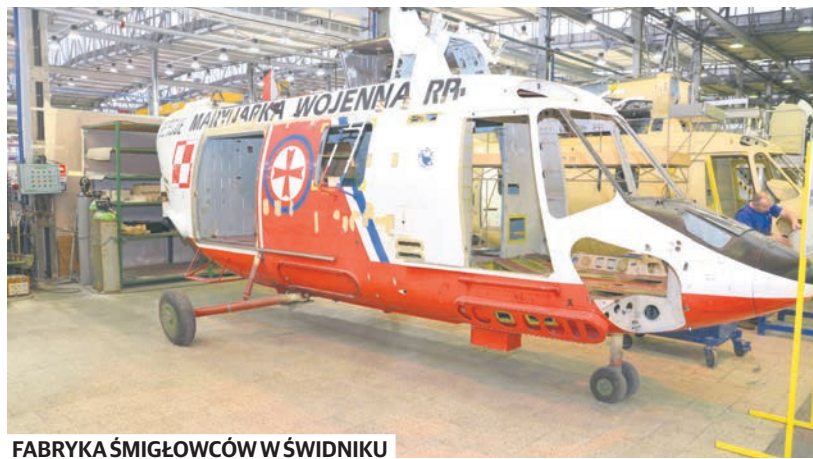
FABRYKA ŚMIGŁOWCÓW W ŚWIDNIKU

Powiat nadzoruje 8 szkół płaconek oświatowych: 5 szkół ponadgimnazjalnych, 2 specjalne ośrodki szkolno-wychowawcze oraz poradnię psychologiczno-pedagogiczną. To, co wyróżnia ich ofertę