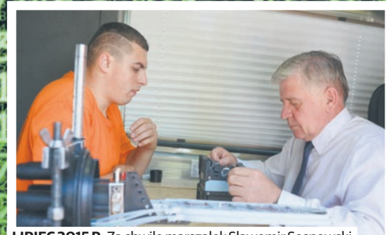
LIPIEC 2015 R. Za chwilę marszałek Sławomir Sosnowski zespara sieci województwa podlaskiego i lubelskiego