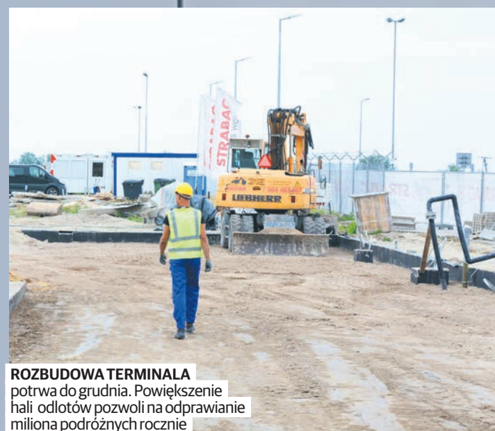
ROZBUDOWA TERMINAŁA potrwa do grudnia. Powiększenie hali odlotów pozwoli na odprawianie miliona podróży rocznie