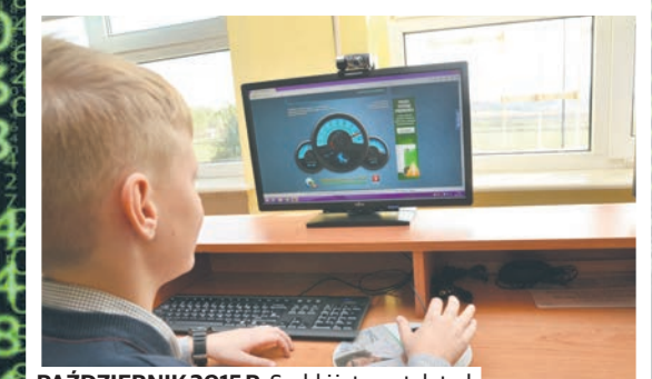
PAŹDZIERNIK 2015 R. Szybki internet dotarł do szkoły w Prawiednikach