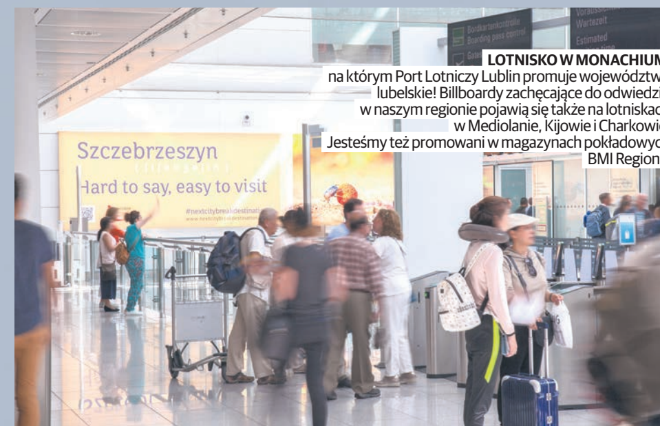
LOTNISKO W MONACHIUM , na którym Port Lotniczy Lublin promuje województwo lubelskie! Billboardy zachęcające do odwiedzin w naszym regionie pojawiają się także na lotniskach w Mediolanie, Kijowie i Charkowie. Jesteśmy też promowani w magazynach pokładowych BMI Regional