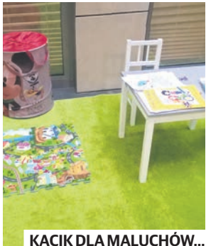
KĄCIK DLA MALUCHÓW...

Na piątym piętrze przygotowano także pokój dla matek karmiących, wyposażony w niezbędne akcesoria. To wielkie udogodnienie dla rodzin, które bez przeszkód i w nieskrępowany sposób mogą być uczestnikami życia społecznego.