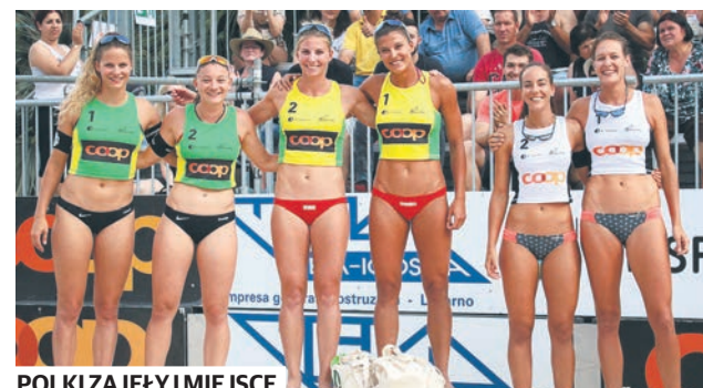
POLKI ZAJĘŁY I MIEJSCE

Na bieg można zapisać się na stronie internetowej: https://polandbusinessrun.pl/member/pl/register/ Liczba miejsc jest ograniczona.