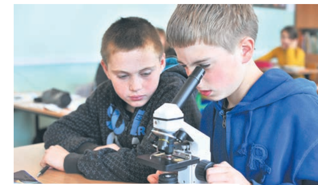
SĄ PIENIĄDZE NA WYPOSAŻENIE PRACOWNI

– Na współczesnym rynku pracy kompetencje kluczowe są niezbędne. Dzięki swoim działaniom, Zarząd Województwa umożliwił ich zdobycie aż 27 tysiącom uczniów. Inwestowanie w ludzi, a szczególnie młodych, jest naszym priorytetem. To podstawa wszelkie-