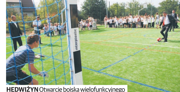
HEDWIZYŃ Otwarcie boiska wielofunkcyjnego

Środki pozyskane z Programu Rozwoju Obszarów Wiejskich władze gminy przeznaczyły również na tzw. zadania miękkie: związane z zachowaniem dziedzictwa kulturowego, historycznego i przyrodniczego gminy Biłgoraj. Dzięki środkom unijnym powstała Ludowa Kapela „Kraślanka” oraz młodzieżowy zespół folkowy „Podkowa”, nagrano monografię filmową zespołu „Jarzębina” z Bukowej, gminne zespoły śpiewacze otrzymały nowe stroje,