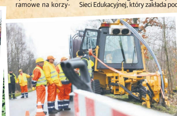
MARZEC 2014 początek budowy sieci