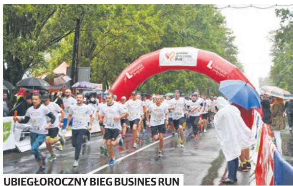
UBIEGŁOROCZNY BIEG BUSINESS RUN

Charytatywna sztafeta Poland Business Run co roku gromadzi na starcie pracowników polskich firm i korporacji, mniejszych przedsiębiorstw, a także znanych aktorów, sportowców i ludzi kultury. Zeszłoroczna edycja była rekordowa pod wieloma względami - w 8 miastach Polski do biegu zgłosiło się ponad 20 tysięcy osób! Udało się zebrać aż 1,6 mln złotych na pomoc