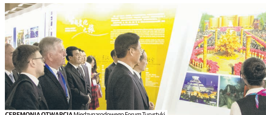
CEREMONIA OTWARCIA Międzynarodowego Forum Turystyki

Podczas spotkania z wicegubernatorem Prowincji Henan podpisaliśmy umowę o współpracy po-