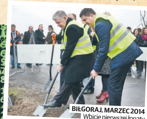
BIŁGORAJ, MARZEC 2014 Wbicie pierwszej łopaty

Każdy z nas widzi, jak bardzo zmieniło się nasze województwo. Chętnie pokazemy też zmiany, które zasły w Państwu miejscowości. Nowe drogi, boiska, przedszkola, a może przedsiębiorstwa, które powstały w sąsiedztwie. Pomysł prosimy przesyłać na e-mail: komunikacja@lubelskie.pl (DC)