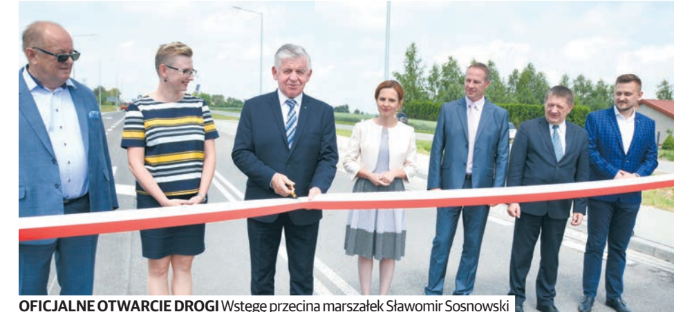
OFICJALNE OTWARCIE DROGI Wstępując przecina marszałek Sławomir Sosnowski

podległości”. Pierwszą „niepodległościówką” była droga wojewódzka nr 829 na odcinku od Łęcznej do Biskupic.