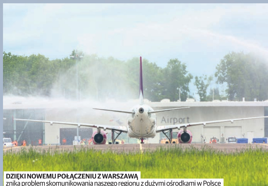
DZIĘKI NOWEMU POŁĄCZENIU Z WARSZAWĄ znika problem skomunikowania naszego regionu z dużymi ośrodkami w Polsce