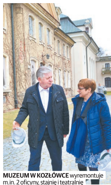
MUZEUM W KOZŁÓWCE wyremontuje m.in. 2 oficyny, stajnię i teatralnię

Bogatsza będzie oferta zajęć edukacyjnych i warsztatów związanych z charakterem zbiorów Muzeum, a także z tematyką wystaw czasowych. Obecnie jest tylko dzieci i młodzież, ale także dorośli, seniorów czy osoby z niepełnosprawnościami.