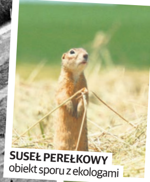
SUSEŁ PEREŁKOWY obiekt sportu z ekologami