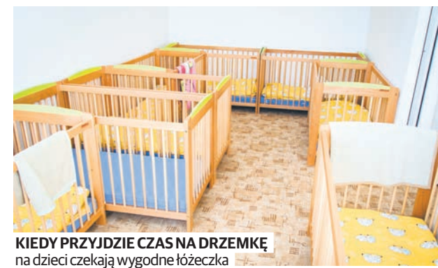
KIEDY PRZYJDZIE CZAS NA DRZEMKĘ na dzieci czekają wygodne łóżeczka

Możliwości takie stwarzają Europejski Fundusz Rozwoju Regionalnego i Europejski Fundusz Społeczny. Pierwszy wspiera tzw. inwestycje twarde, a więc budowę, modernizację i wyposażenie żłobków i przedszkoli. Drugi zabezpie-