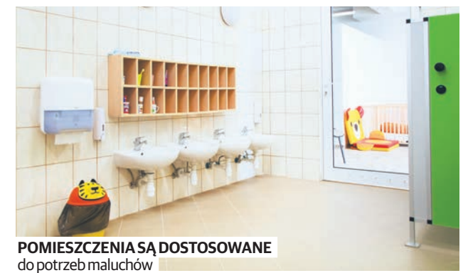
POMIESZCZENIA SĄ DOSTOSOWANE do potrzeb maluchów

Działania związane z tworzeniem miejsc w żłobkach są powiązane z rynkiem pracy. Szacuje się, że dzięki już rozstrzygniętym konkursom, po przerwie związanej z urodzeniem lub wychowywaniem dzieci, powróci na rynek pracy 454 ich opiekunów, a ponad 400 kolejnych znajdzie pracę. Stefan Jaworski