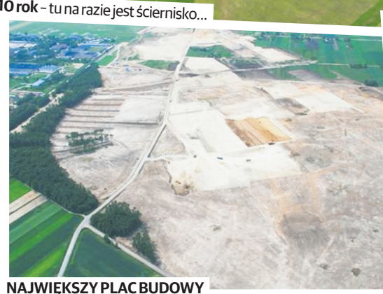
NAJWIĘKSZY PLAC BUDOWY