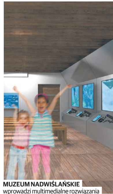
MUZEUM NADWIŚLAŃSKIE wprowadzi multimedialne rozwiązania

Na przebudowę i konserwację budynków Muzeum Zamoyckich w Kozłowie otrzyma 29,66 mln zł. Nowe życie dostaną dwie oficyny, stajnia i teatralnia. Projekt obejmuje wykonanie robót budowlano-konserwatorskich i instalacyjnych, zagospodarowanie terenu, a także zakup wyposażenia niezbędnego do stworzenia nowej oferty kulturalno-edukacyjnej. Atrakcją będzie udostępnienie turystom dodatkowej infrastruktury, dotychczas nie użytkowanej. Miejsca te zostaną przeznaczone na nowe interaktywne wystawy, również multimedialne.