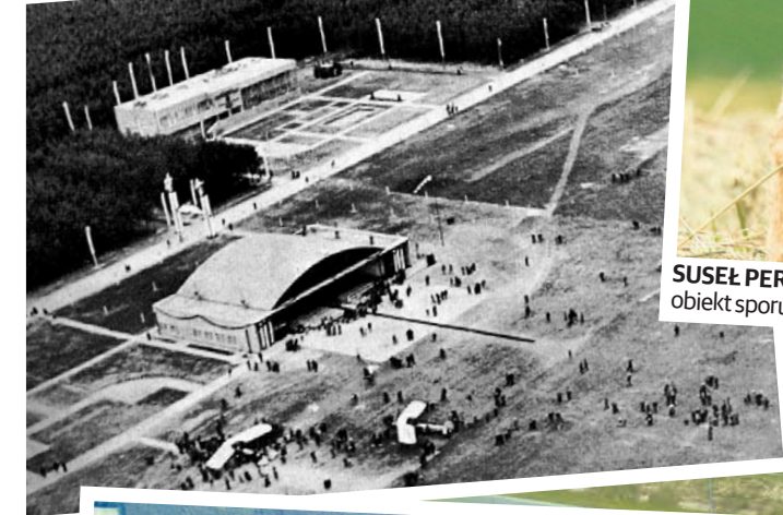
1938 rok – widok na lotnisko w Świdniku

Każdy z nas widzi, jak bardzo zmieniło się nasze województwo. Chętnie pokażemy też zmiany, które zaszły w Państwie miejscowości. Nowe drogi, boiska, przedszkola, a może przedsiębiorstwa, które powstały w sąsiedztwie. Pomysły prosimy przysyłać na e-mail: komunikacja@lubelskie.pl (KM)