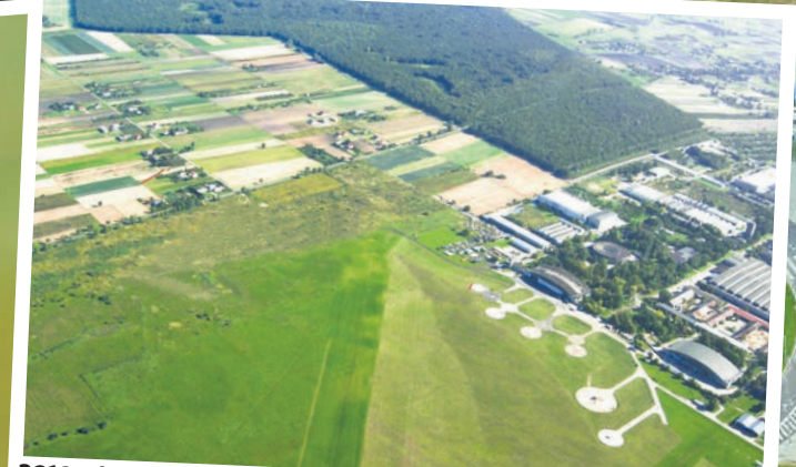
2010 rok – tu na razie jest ściernisko...