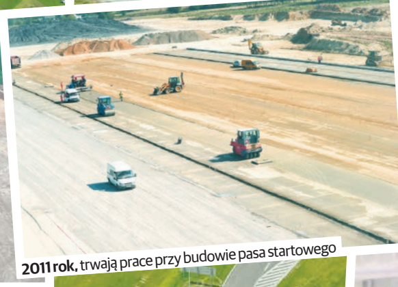
2011 rok, trwają prace przy budowie pasa startowego