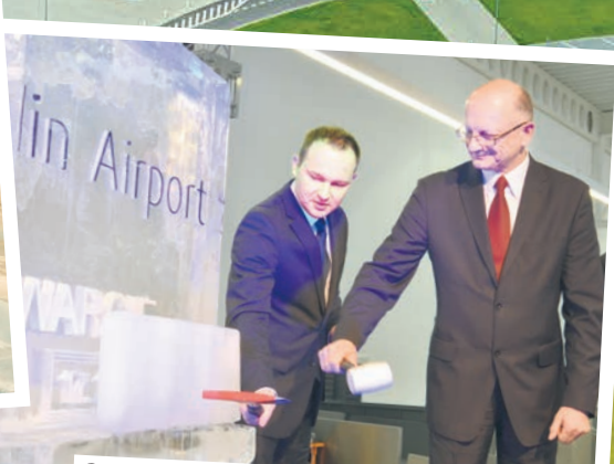
GRUDZIEŃ 2012 rok, uroczystego otwarcia dokonują marszałek Krzysztof Hetman i prezydent Krzysztof Żuk