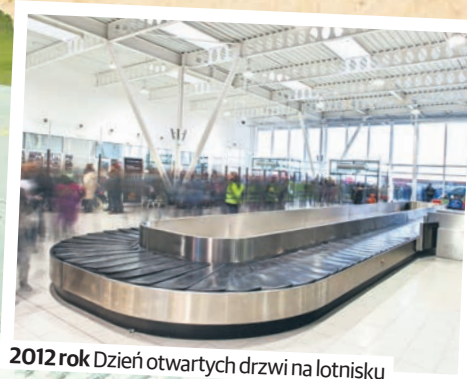
2012 rok Dzień otwartych drzwi na lotnisku