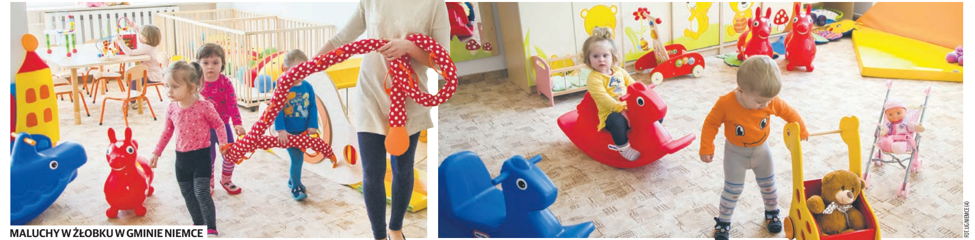
MALUCHY W ŻŁOBKU W GMINIE NIEMCE