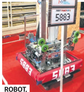
ROBOT, który zapewnił zwycięstwo drużynie Spice Gears w Chinach

wodach, wykonując z góry zaplanowane czynności.